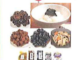
地元名産 天下一品の味 (株) 南部フーズ