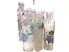
人気爆発 ハーバリウム (株) ミナロ