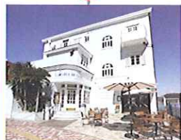
葉山の名店のお菓子 ラ・マーレド・チャヤ