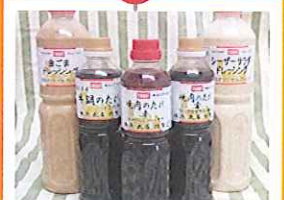
言わずと知れた 地元産 焼肉のたれ (株) 武居商店