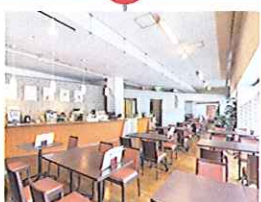
工場直売コーナーが併設された 新しいタイプのカフェ 横浜テクノタワーホテル カフェ&マーケット コア