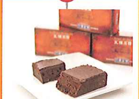
本格仏蘭西料理店 「横浜元町 霧笛楼」の仏蘭西菓子 横浜元町 霧笛楼