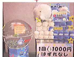
みんなの八景島 イルカグッズ 横浜・八景島シーパラダイス