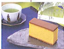
歴史と伝統のスイーツの王様 文明堂