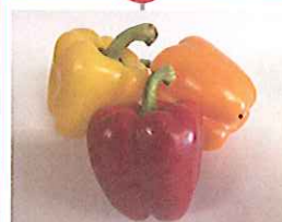
最先端テクノロジーで農業を発展させる リッチフィールド (株)