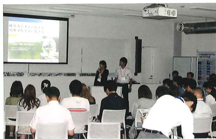
地元企業×地元大学生の交流会 Cross Meeting