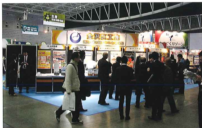
金沢区工連としてテクニカルショウヨコハマ2016へ出展