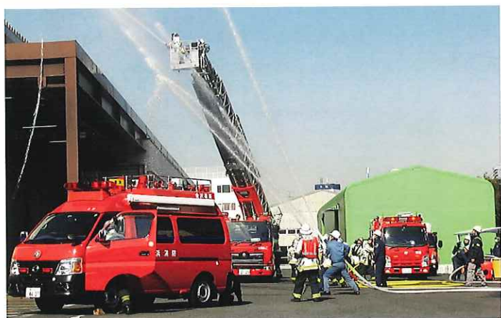
金沢臨海部自衛消防組織合同消防訓練