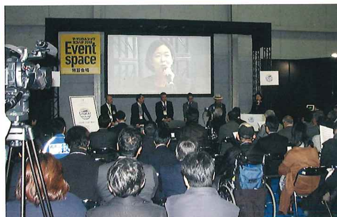
テクニカルショウ ヨコハマ 2018