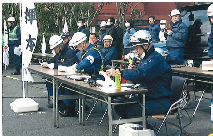
金沢臨海部自衛消防組織訓練会