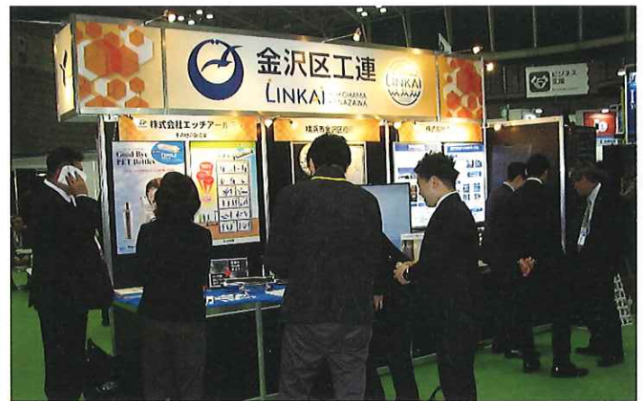
テクニカルショウ ヨコハマ 2019