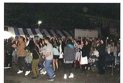
—昨年のPIAフェスタ歌うま選手権

近々にPIAフェスタ実行委員会を開催し、PIAフェスタの開催の可否等について検討いたします。