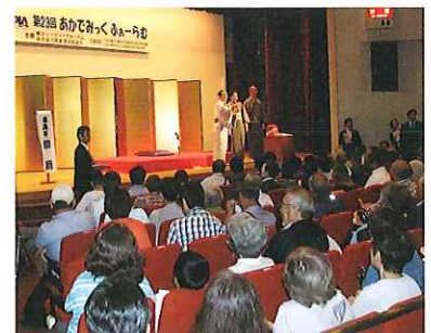
昨年の落語勉強会

海辺帆羅夢落語勉強会を楽しみにされている皆様、どうぞ、ご理解をお願いいたします。