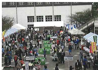
—昨年のPIAフェスタ風景

例年、秋に開催しているPIAフェスタですが、昨年は台風15号の来襲により金沢産業団地企業の多くが被災し、PIAフェスタどころでは無くなってしまい中止となりました。今年のPIAフェスタについては昨年中止となったこともあり、開催したいとの思いもありますが、今年に入ってから新型コロナウイルス感染症が流行している状況があります。