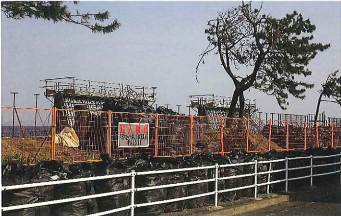
防波堤工事(嵩上げ)