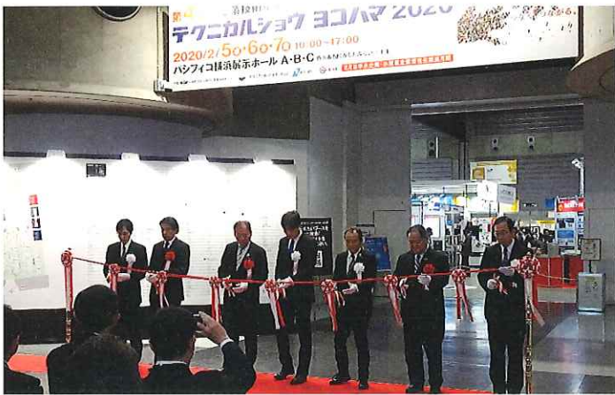
テクニカルショウ