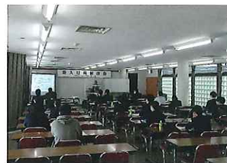
新規採用者安全衛生講習