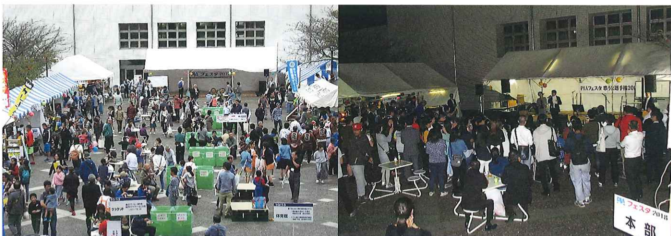
前回開催時 PIA フェスタ風景

今後、PIAフェスタの具体的なイベント等が決定いたしましたら、会員企業の皆様にお知らせ致しますので、もう少々お待ちください。