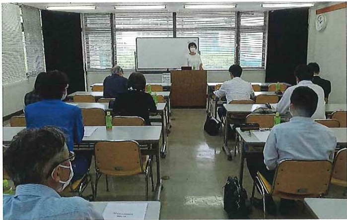
ハラスメント対策義務化準備セミナー